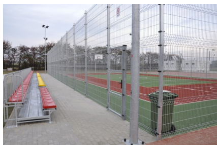
Kompleks boisk sportowych „Orlik 2012” przy ZS Nr1 w Goworowie

Z radością komunikuję, że dokończyliśmy budowę kompleksu boisk sportowych „Orlik 2012” przy Zespole Szkół Nr 1 w Goworowie. Inwestycja rozpoczęta w 2011 r., niestety nie dokończona w terminie z powodu nierzetelności wykonawcy. W wyniku wielu starań udało mi się pozyskać dofinansowanie z Urzędu Marszałkowskiego – 164.000 zł i Ministerstwa Sportu 669.000,00 zł. Wartość całej inwestycji to 1.282.000,00 zł. Odroczenie wykonawstwa dało nam możliwość zmiany ogrodzenia na panelowe oraz dodatkowego wykonania bieżni 60 m (3 tory) z poliuretanu, zakończonej skocznią w dal oraz trybuny. W ramach zadania wykonano boisko do piłki nożnej z nawierzchnią z trawy sztucznej o wymiarach 30 m x 60 m oraz boisko wielofunkcyjne o nawierzchni poliuretanowej o wymiarach 19,1 m x