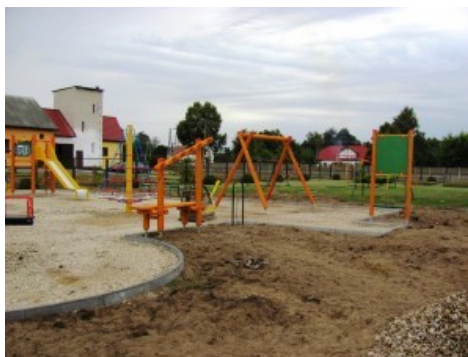
Plac zabaw przy SP w Kuninie

W ramach programu „Radosna Szkoła” powstały dwa place zabaw przy Szkołach Podstawowych w Pasiekach i Kuninie. Prace budowlane wykonywane były przez