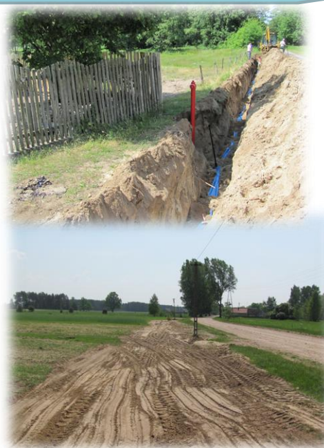
Wodociąg m. Jurgi i m. Zaorze