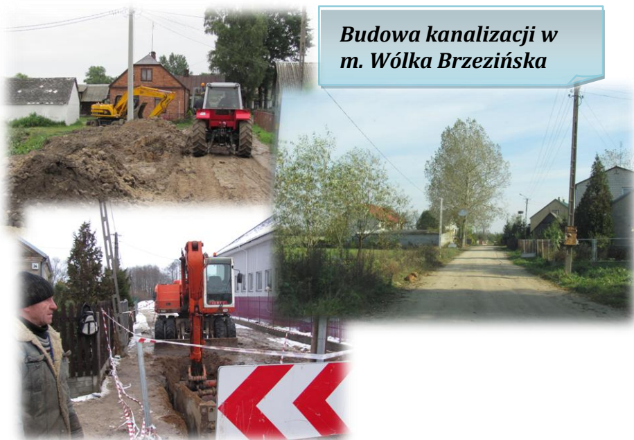
Budowa kanalizacji w m. Wólka Brzezińska