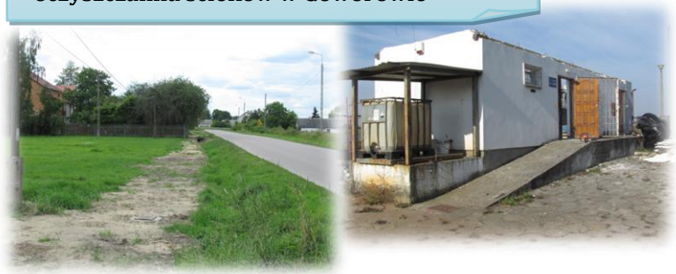
Kanalizacja m. Wólka Brzezińska i oczyszczalnia ścieków w Goworowie