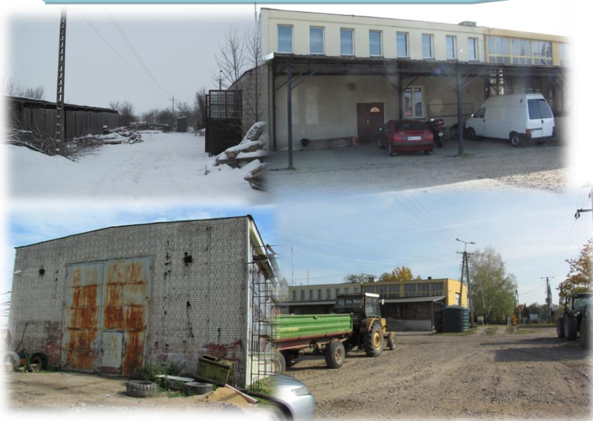
Punkt Selektywnej Zbiórki Odpadów Komunalnych