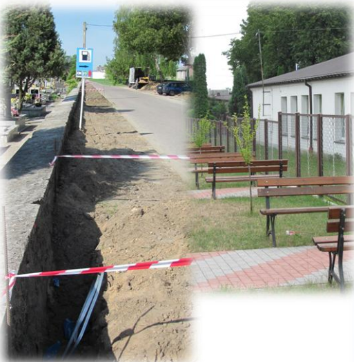
Zagospodarowanie przestrzeni publicznej w Goworowie