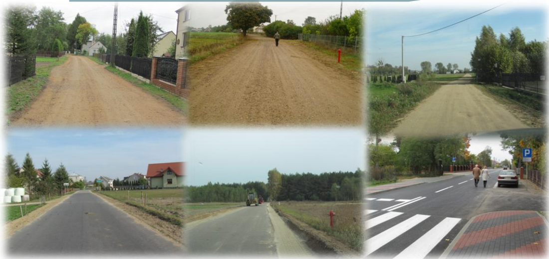
Drogi w m. Pasieki, m. Borki, m. Grodzisk Mały, m. Kunin, m. Lipianka - Damięty, m. Jemieliste - Kaczka,