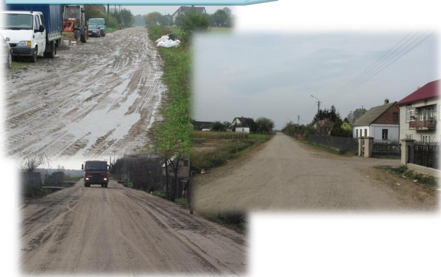
Modernizacja drogi w m. Grodzisk Mały