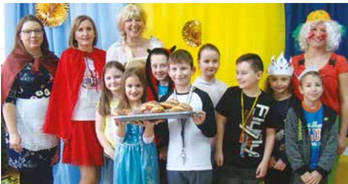
Wychowawcy świetlicy i uczniowie podczas balu