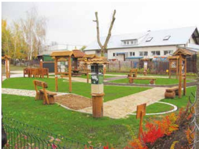
Ścieżka edukacyjna i sensoryczna w Goworowie

- firma ART-BRUK Paweł Łasiewicki Wólka Brzezińska za kwotę 161 910,00 zł wykonała na placu pomiędzy Urzędem Gminy Goworowo i budynkiem pocztowym „Budowę ogólnodostępnej, niekomercyjnej infrastruktury rekreacyjnej w miejscowości Goworowo”, obejmującą część 1 zamówienia „Wzrokiem i dotykem poznaję przyrodę – budowa ścieżki edukacyjnej w Goworowie” i część 2 „Budowa placu zabaw”. Zadanie zostało dofinansowane ze środków WFOŚiGW w Warszawie w kwocie 59 053,15 zł oraz ze środków Powiatu Ostrołęckiego w kwocie 25 000,00 zł, a także współfinansowane w ramach funduszu sołectwa miejscowości Goworowo w kwocie 28 290,00 zł. W obecnym roku wykonane zostaną pozostałe prace budowlane i montażowe, których łącznym efektem będzie powstanie w Goworowie ogólnodostępnej infrastruktury edukacji ekologicznej i aktywności ruchowej. Niewątpliwym atutem tego miejsca będzie zapewnienie bezpieczeństwa najmłodszym, ponieważ cały teren jest ogrodzony, położony w sąsiedztwie Posterunku Policji w Goworowie, a w jego sąsiedztwie nie odbywa się żaden ruch pojazdów mechanicznych. Kompletnie miejsce rekreacji powinno być gotowe na początek wakacji;