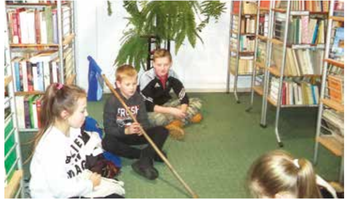
Dzieci podczas zajęć w bibliotece

W tegoroczne ferie zimowe biblioteka także nie zapomniała o dzieciach i o promowaniu czytelnictwa, a także o jej głównej powinności, jaką jest niesienie wiedzy i mądrości dla młodych osób. Aby umożliwić dzieciom lepsze zapoznanie się z literaturą wybitnych pisarzy dziecięcych, jakimi są Hans CH. Andersen