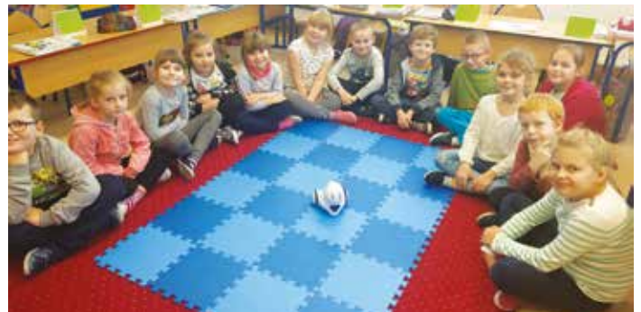
Zajęcia programowania w szkole w Kuninie.

ku zorganizowała lekcję pokazową z robotem PHOTON oraz tygodniowy test robota OZOBOT.