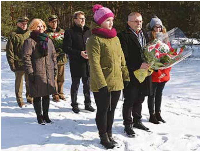
Delegacja składająca kwiaty

1 marca 2018 r. po raz kolejny w Szkole Podstawowej w Kuninie uczciliśmy pamięć „Żołnierzy Wyklętych”. Cała społeczność szkolna oddała hołd „Niezlomnym” podczas uroczystego apelu. Dzień ten poświęcony jest polskim żołnierzom antykomunistycznego i niepodległościowego podziemia działającego w latach 1944-1963.