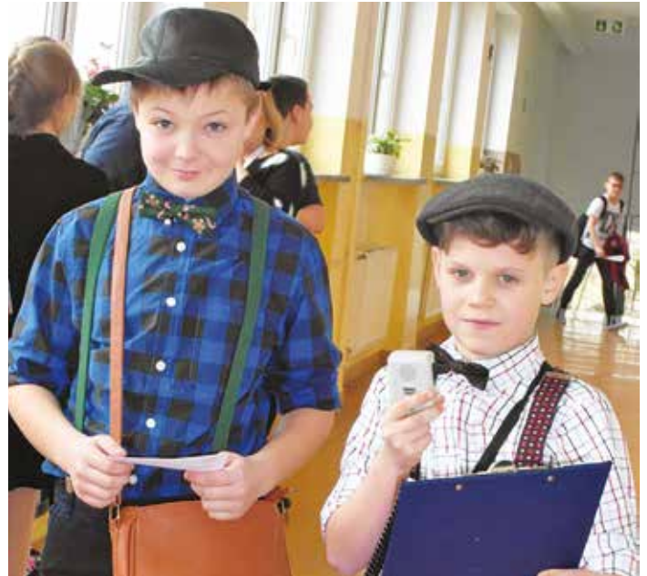
Obchody Dnia Patrona SP Goworowo