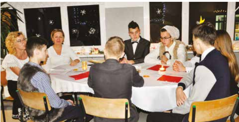
Nauczycielki wraz z uczniami podczas Wieczornicy

13 XII 2017 r. w 36 rocznicę wprowadzenia stanu wojennego w Polsce, w SP im. Mikołaja Kopernika w Goworowie, po raz pierwszy odbyła się Wieczornica Bożonarodzeniowa pod hasłem: Anioły są wśród nas. Dała ona początek