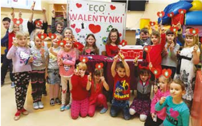
Eco Walentynki w Kuninie

Przyroda otacza nas ze wszystkich stron i decyduje o życiu na Ziemi. Jest dla człowieka podstawą wyżywienia, źródłem wiedzy i radości. Wpływ rozwoju techniki, przemysłu, komunikacji oraz powstających budowli sprawił, że przyroda została poważnie zagrożona. Największym problemem współczesnych czasów jest zanieczyszczenie środowiska, spowodowane różnymi działaniami człowieka. Jedno z nich to wyrzucanie do śmieci elektroodpadów. Zawierają one bardzo szkodliwe substancje dla naszego zdrowia oraz niszczą naszą planetę.