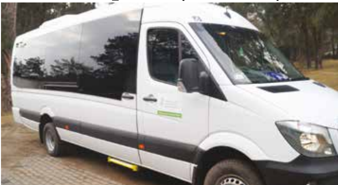
Nowy autobus na potrzeby ŚDS w Czarnowie

Gmina Goworowo zakupiła z „Programu wyrównywania różnic między regionami III” autobus marki MERCUS 9068850 MB SPRINTER przeznaczony na potrzeby Środowiskowego Domu Samopomocy w Czarnowie, który ułatwi organizację dowozu uczestników i zapewni bezpieczeństwo i komfort jazdy. Autobus został zakupiony w drodze postępowania o udzielenie zamówienia publicznego prowadzonego w trybie przetargu nieograniczonego.