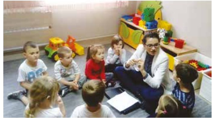
Dzieci z psychologiem (fot. ach. Przedszkola w Goworowie)

przeprowadziła zajęcia edukacyjne dla dzieci i pogadankę dla rodziców pt. „Ochrona dzieci w Internecie”.