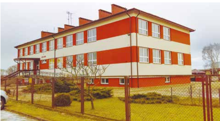
Budynek szkoły podstawowej w Kuninie po termomodernizacji

Gmina Goworowo zawarła z Województwem Mazowieckim umowę nr RPMA.04.02.00-14-5353/16-00 o dofinansowanie Projektu „Efektywność energetyczna związana z termomodernizacją budynku szkoły podstawowej w Kuninie w gminie Goworowo”, współfi-