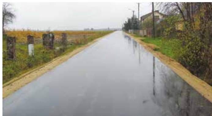
Nowa nawierzchnia na drodze w Grodzisku Małym (źródło arch. UG)

cinki jezdni o długości 1527 mb oraz 676 mb na gruntach wsi Wólka Brzezińska od strony Czerni miało wykonać Przedsiębiorstwo Robót Drogowo – Mostowych „OSTRADA” Sp. z o.o. z Ostrołęki za kwotę 1 074 935,81 zł brutto. Z uwagi na rozmoknięty korpus drogowy nawierzchnia asfaltowa została ułożona tylko na krótszym odcinku jezdni. Część drugą zamówienia, tj. 1242,5 mb nawierzchni utwardzonej pomiędzy dwiema drogami powiatowymi w Grodzisku Małym oraz 520,7 mb nawierzchni utwardzonej od drogi powiatowej Ostrołęka – Goworowo do pasa kolejowego linii Ostrołęka – Tłuszcz w Damiętach miało wykonać Przedsiębiorstwo Budowy i Utrzymania Dróg Sp. z o.o. z Ostrowi Mazowieckiej za kwotę 647 909,03 zł. Z uwagi na rozmoknięty korpus drogowy nawierzchnia asfaltowa została ułożona tylko w Grodzisku Małym. Pozostałe w ramach zamówienia odcinki dróg zostaną wykonane niezwłocznie po ustąpieniu niekorzystnych warunków atmosferycznych;