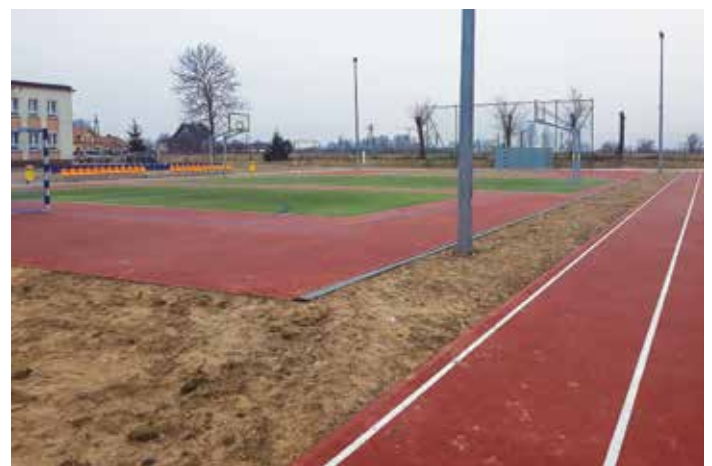
Widok na boisko wielofunkcyjne w Pasiekach

wódzkiego Funduszu Ochrony Środowiska i Gospodarki Wodnej w Warszawie w kwocie 1 180 000,00 zł. Ponadto samorząd odzyska cały poniesiony na inwestycję podatek VAT. Firma Wielobranżowa