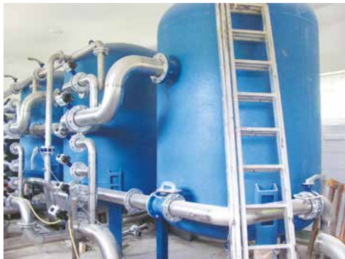
Budowa układu filtracyjnego w SUW Brzeźno

Wiodącymi, a co za tym idzie i najdroższymi, inwestycjami w 2017 roku było wykonanie modernizacji Stacji Uzdatniania Wody w Ponikwi Małej i Brzeźnie, wykonanie kompleksowej termomodernizacji budynku Szkoły Podstawowej w Kuninie oraz budowa boisk wielofunkcyjnych w Pasiekach i Kuninie. W ramach inwestycji pn. „Modernizacja stacji uzdatniania wody w msc. Brzeźno i Ponikiew Mała” na SUW Brzeźno wykonano m. in. wymianę pompy głębinowej, wymianę urządzeń układu technologicznego uzdatniania wody o wydajności 45 m 3 /h, montaż nowego zestawu hydroforowego, nowy rurociąg wody surowej, neutralizator ścieków z chlorowni, zbiornik retencyjny o wielkości