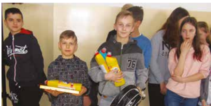
Laureaci konkursu wzorowa łazienka

Szkoła Podstawowa w Pasiokach odniosła sukces w realizacji programu społeczno - edukacyjnego „Wzorowa łazienka 2017” zainicjowanego przez markę Domestos. Nadrzędnym celem programu jest poprawa stanu higieny i czystości w polskich szkołach, a tym samym zwiększenie bezpieczeństwa i dbałość o zdrowie najmłodszych.