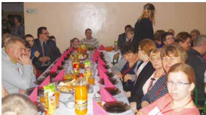
Bal Walentynkowy

Na początku roku uczestnicy Środowiskowego Domu Samopomocy w Czarnowie wraz z opiekunami i rodzicami oraz Stowarzyszeniem „Jesteśmy Betanią” wzięli udział w balu walentynkowym zorganizowanym przez zaprzyjaźnioną placówkę z Olszewo Borek. Bal odbył się w sobotę 13 stycznia w Zespole Szkół znajdującym się w miejscowości Nowa Wieś. Fakt, iż co roku aktywnie i z dużym zaangażowaniem uczestniczymy we wspomnianej imprezie, świadczy o nici współpracy jaką udało nam się zawiązać pomiędzy ŚDS w Czarnowie a Gminnym Ośrodkiem Pomocy Społecznej w Olszewo Borkach. Udział we wspomnianym przedsięwzięciu stanowi jedną z form realizacji treningu spędzania czasu wolnego, jakim objęci są uczestnicy ŚDS w Czarnowie. Zdarzenia związane z możliwością doświadczania funkcjonowania w innej grupie niż ta, z którą na co dzień stykają się uczestnicy ŚDS, pozwala nie tylko na integrację z innymi osobami niepełnosprawnymi, ale również na wykorzystanie wiedzy i umiejętności, jakie nabywają nasi podopieczni w trakcie udziału w różnych treningach przewidzianych w działalności Naszego Domu.