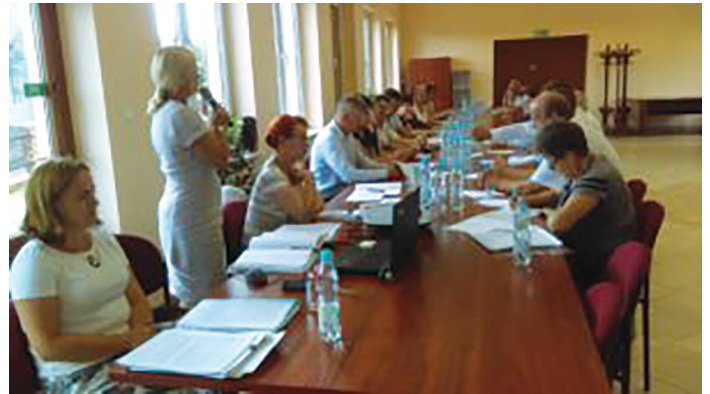
LI sesja Rady Gminy Goworowo

19 czerwca 2018 r. odbyła się LI sesja Rady Gminy. Rada podjęła 9 uchwał, ale głównym tematem sesji było przyjęcie sprawozdania z wykonania budżetu gminy za 2017 r.