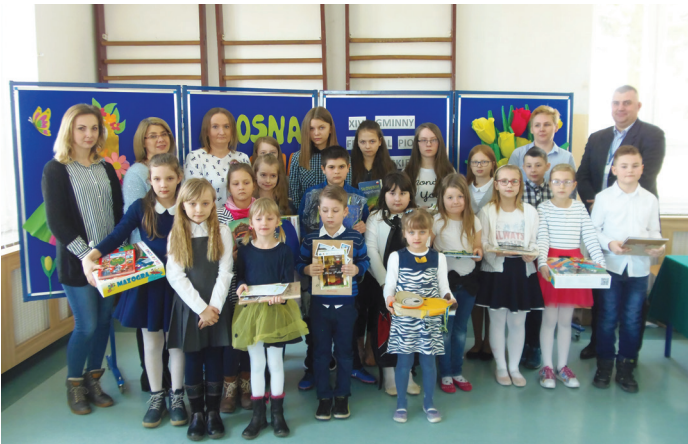
Gminny festiwal piosenki w Pasiekach

Ludzki głos to najdoskonalszy instrument. Nie jest istotne jak śpiewasz – dźwięcznie jak skowronek, czy gardłowo jak sójka. Po prostu przywołaj w myśli ulubioną piosenkę, weź oddech, otwórz usta i zacznij! Cytując św. Augustyna, „Śpiewajcie głosem, śpiewajcie sercem, śpiewajcie ustami, śpiewajcie swoim życiem”.