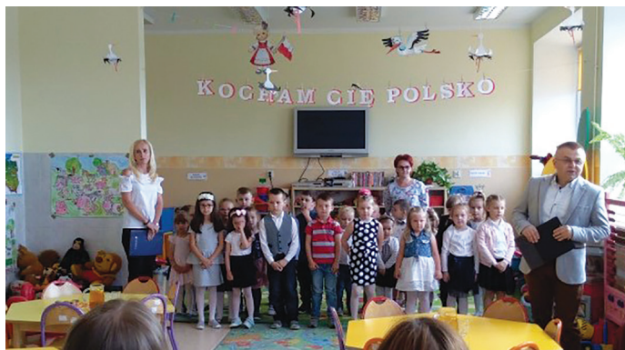
Uczniowie podczas uroczystości szkolnej

W edukacji przedszkolnej realizowane są treści wychowania patriotycznego, a głównym zadaniem przedszkola jest budzenie u dzieci szacunku do regionalnej tradycji oraz miłości do małej i dużej Ojczyzny.