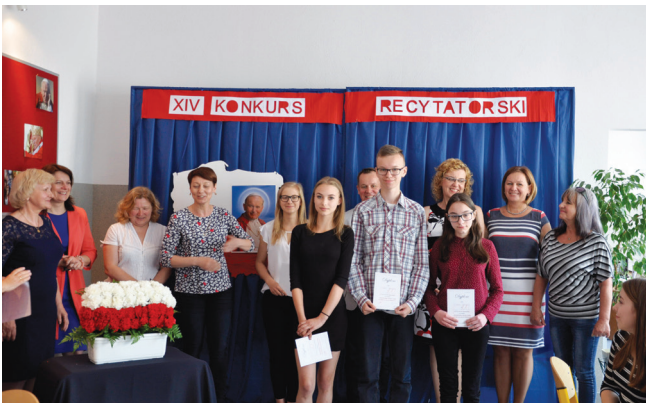
Uczniowie i nauczyciele podczas koncertu patriotycznego

Byłam na pięknym koncercie poezji patriotycznej w wykonaniu uczniów Szkoły Podstawowej i Gimnazjum w Goworowie.