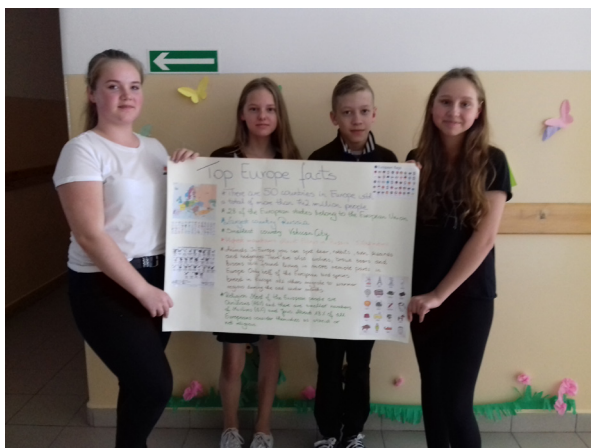
Uczniowie SP w Kuninie