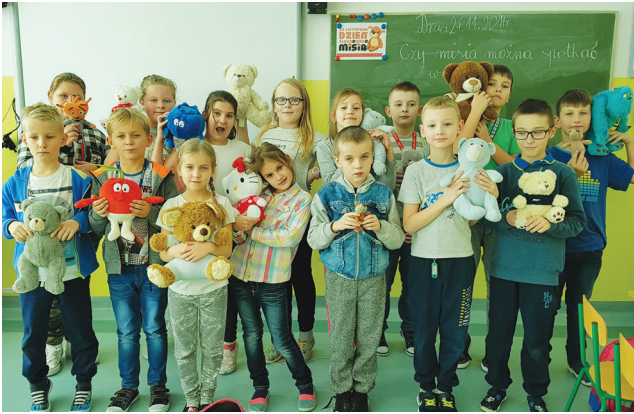
Uczniowie klasy IIIc SP Goworowo

Klasa IIIc Szkoły Podstawowej im. M. Kopernika w Goworowie w roku szkolnym 2017/2018 od listopada 2017 r. do maja