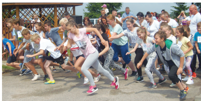
Uczestnicy biegu

26 maja w szkole w Pasiekach odbył się festyn. Celem imprezy było zintegrowanie rodziców, dzieci, młodzieży i pracowników szkoły i włączenie wszystkich uczestników do wspólnej zabawy. Mimo że od rana pogoda była kapryśna, dopisały dzieci i ich rodziny. W czasie imprezy można było wziąć udział w różnych konkurencjach sportowych, zespołowych i indywidualnych. Na boisku szkolnym rozgrywały się mecze