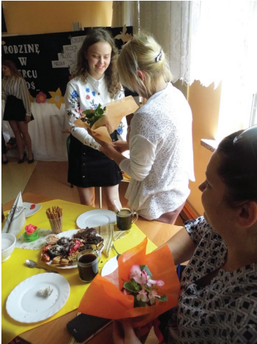
Dzień Rodziny w ZSP

- to myśl przewodnia towarzysząca uroczystości zorganizowanej w Zespole Szkół Powiatowych w Goworowie 25.05.2018 r. Idea, jaka przyświecała zorganizowaniu tego wydarzenia, to podkreślenie, jak ważną rolę odgrywa rodzina w życiu każdego człowieka. Młodzież z ZSP w Goworowie wzruszyła do łez nie tylko przepięknymi piosenkami dla rodziców, podziękowaniami dla nich, ale też dając popis umiejętności aktorskich w przedstawieniu: „15 minut z życia rodziny”. Autorami byli młodzi ludzie uczęszczający do naszej szkoły. Pokazali rodzi-