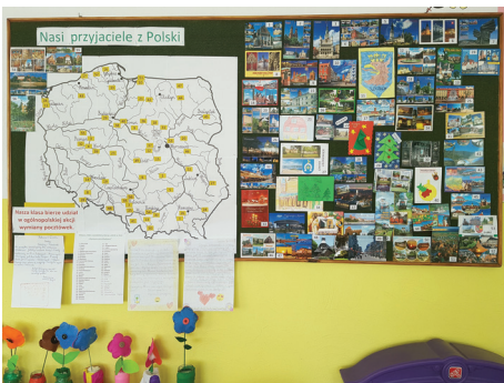
Wymiana pocztówkowa

W obecnych czasach pisanie do kogoś listów i wysyłanie pocztówek z pozdrowieniami odchodzi w niepamięć. Każdy woli napisać SMS-a lub e-maila, bo tak jest łatwiej i wygodniej.