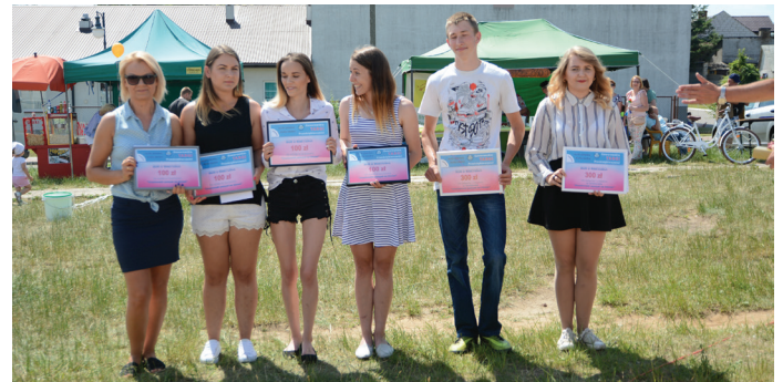
Nagrodzeni uczestnicy konkursu