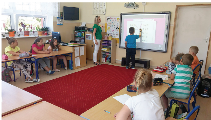
Uczniowie SP w Kuninie podczas lekcji z wykorzystaniem tablicy

Rozwijanie kompetencji uczniów i nauczycieli w zakresie stosowania technologii informacyjno-komunikacyjnych (TIK) w edukacji oraz rozwijanie szkolnej infrastruktury to kluczowe działania sprzyjające osiągnięciu sukcesu edukacyjnego uczniów. Zgodnie też z dokumentem Europa 2020 strategia na rzecz inteligentnego i zrównoważonego rozwoju sprzyjającego włączeniu społecznemu, zwiększenie roli wiedzy i innowacji jest uważane za siłę napędową przyszłego rozwoju i podstawę budowania przewag konkurencyjnych Unii Europejskiej na rynkach