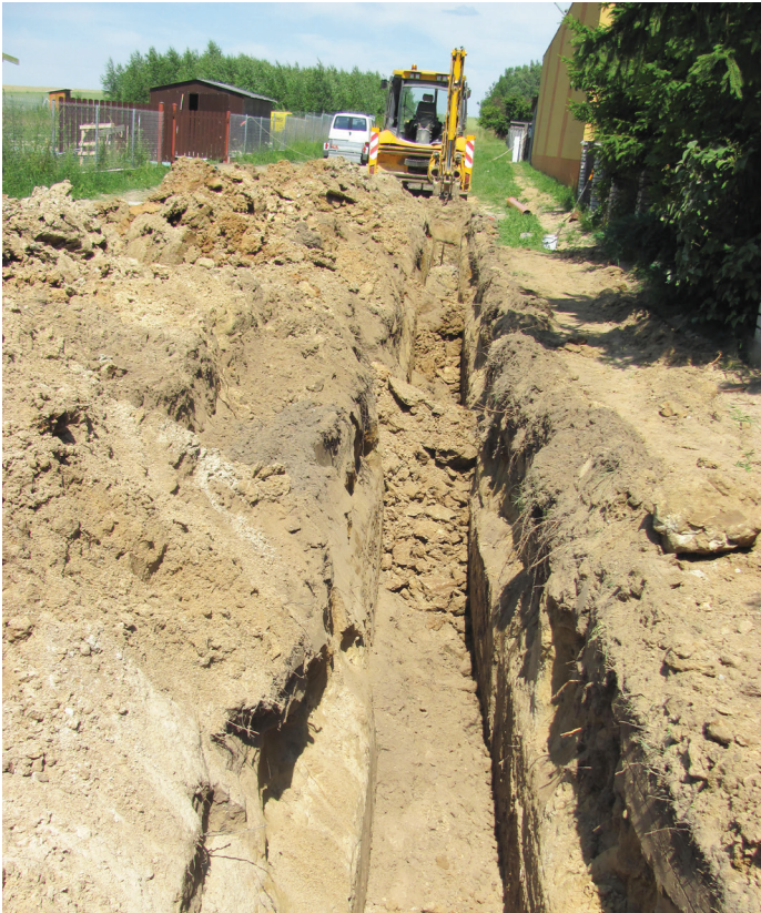
Budowa sieci kanalizacji sanitarnej

- w dniu 24 maja 2018 r. została podpisana umowa na kwotę 1 234 000,00 zł brutto z firmą MULTI-KOM Andrzej Nakielski z Ostrołęki na wykonanie zadania pn. „Rozwój gospodarki wodno-ściekowej w dolinie rzek Orz i Narew w gminie Goworowo. Etap III: Goworowo – Szczawin – Daniłowo”. W ramach inwestycji wykonywana sieć kanalizacyjna w części Goworowa od strony Szczawina oraz przejście siecią tłoczną wzdłuż drogi powiatowej do Szczawina o łącznej długości 2718,90 m oraz przebudowane zostanie 128,00 m sieci wodociągowej w msc. Szczawin. Rozpoczęte już prace mają się zakończyć do 29 października br.;