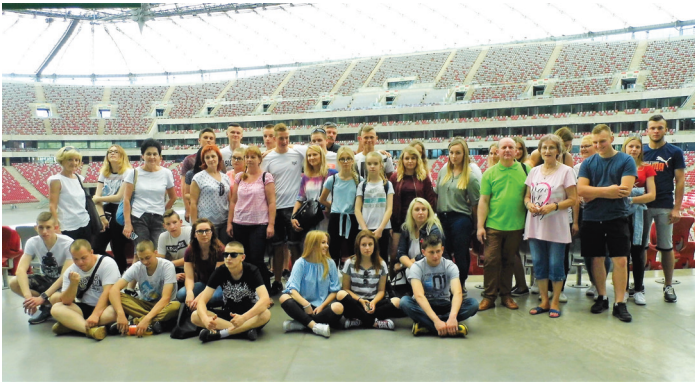
Uczniowie ZSP w Goworowie na Stadionie Narodowym w Warszawie

W szkolny program obchodów setnej rocznicy odzyskania niepodległości przez Polskę barwnie wpisala się wycieczka uczniów Zespołu Szkół Powiatowych. 30 maja 2018 roku 45 uczniów i nauczycieli zwiedziło w Warszawie Belweder, a w nim wystawę poświęconą marszałkowi Józefowi Piłsudskiemu, gdzie pracował i zmarł, historii Orderu Wojennego Virtuti Militari oraz wybranych sal historycznych. Groby żołnierzy Bitwy Warszawskiej z 1920 r., która decydująco wpłynęła na losy Europy, odwiedziliśmy na wojskowych Powązkach. Zapaliliśmy znicze przy pomnikach powstańców listopadowych i styczniowych, żołnierzy I i II wojny światowej, konspiratorów ruchu oporu i powstańców warszawskich. Byliśmy przy grobach polityków, działaczy i artystów, którzy w mniejszym lub większym stopniu wpłynęli na kształt życia wielu pokoleń Polaków w minionym stuleciu. Jednym z nich był grobowiec Marka Kotańskiego, który tak wiele uczynił dla bezdomnych i uzależnionych. Był m.in. założycielem Monaru w Lipiance.