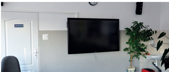
Jeden z monitorów dotykowych w SP im. M. Kopernika w Goworowie

C ztery interaktywne monitory dotykowe 65” ze zintegrowanym oprogramowaniem IIYAMA PROLITE to nowe wyposażenie Szkoły Podstawowej im. Mikołaja Kopernika w Goworowie oraz jej Filii w Szczawinie, zrealizowane w ramach programu rządowego „Aktywna tablica”.