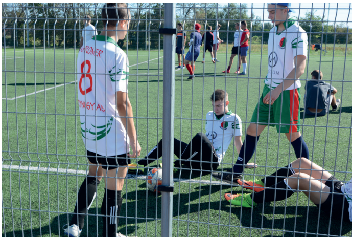
„Turniej Dzikich Drużyn” przyciąga młodych sportowców

A ktywność fizyczna jest bardzo ważnym elementem w życiu młodego człowieka. Ma wpływ na rozwój fizyczny i psychiczny. Niesie wiele zalet w szeroko rozumianym życiu społecznym. Każda aktywność fizyczna, która jest właściwie dobrana, ma pozytywny wpływ na życie każdego młodego człowieka. Stymuluje wydzielanie endorfin – tzw. „hormonów szczęścia”, może być najlepszą zachętą do wprowadzenia ruchu w swoje