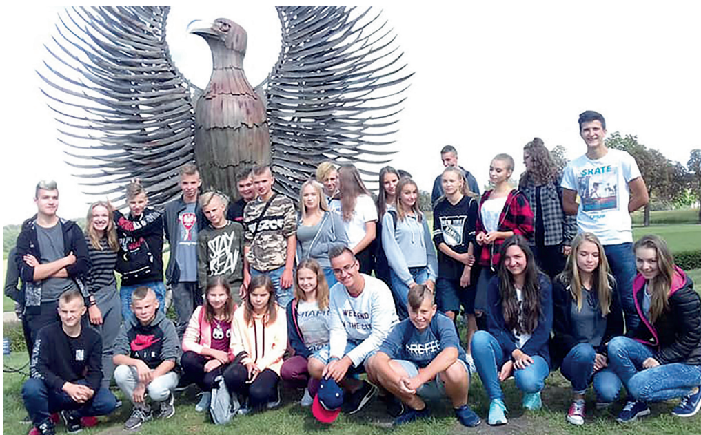
Uczestnicy projektu

T owarzystwo Przyjaciół Goworowszczyzny, Gminny Ośrodek Kultury, Sportu i Rekreacji w Goworowie oraz Przedsiębiorstwo Handlowo Usługowe „Bursztyn” Anny Sadowskiej to podmioty, które wspierają przedsięwzięcia mające pomóc w rozwoju osobowości młodych ludzi, sprzyjać nabywaniu nowych umiejętności oraz promować aktywność obywatelską. Konieczne jest rozwijanie u młodych ludzi: samodzielności w myśleniu i działaniu, kreatywności, pomysłowości, a także wytrwałości, lojalności i niezawodności.