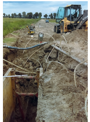
Budowa kanalizacji sanitarnej w Goworowie

Do realizacji w 2018 roku przewidziane są także kolejne inwestycje, gdzie dokonano już wyboru wykonawcy. Wykonana zostanie rozbudowa placu zabaw w Goworowie poprzez ustawienie kolejnych urządzeń dla dzieci oraz siłowni zewnętrznej dla dorosłych. Zadanie pn. „Wyposażenie miejsca rekreacji w Goworowie” współfinansowano przy pomocy środków z budżetu Województwa Mazowieckiego w ramach „Mazowieckiego Instrumentu Aktywizacji Sołectw MAZOWSZE 2018” oraz ze środków funduszu sołectkiego wsi Goworowo. W Lipiance, przy budynku Ośrodka Edukacji Regionalnej, powstanie otwarta strefa aktywności. Zadanie, w ramach którego powstaną plac zabaw, siłownia zewnętrzna oraz elementy małej architektury rekreacyjnej, zostanie dofinansowane przez Ministra Sportu i Turystyki w ramach Programu rozwoju małej infrastruktury sportowo-rekreacyjnej o charakterze wielopokoleniowym