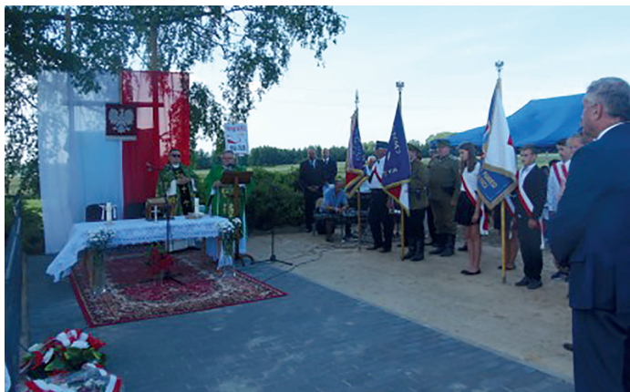
(fot. archiwum ZSP w Goworowie)

„Zachowaj moc ich i oddaj im, Panie ziemię ojczystą na wieczne władanie”