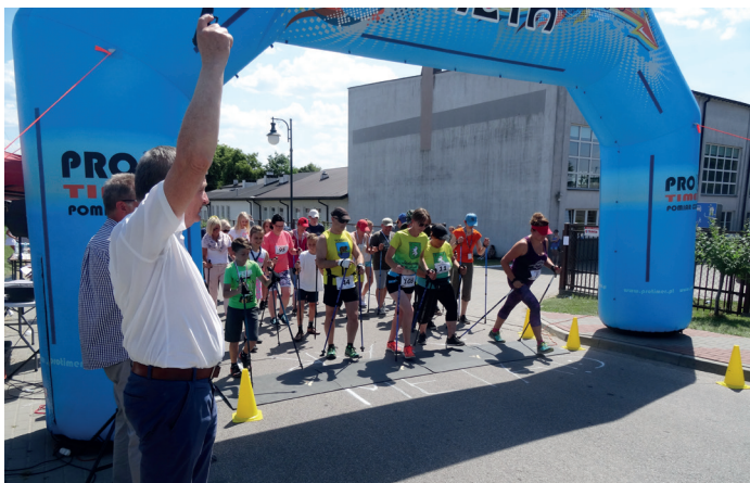
Start uczestników VII Biegu Goworowskiego

10 czerwca 2018 roku odbył się VII Bieg Goworowski „Bieg dla zdrowia”, zorganizowany przez Wójta Gminy Goworowo oraz Gminny Ośrodek Pomocy Społecznej w Goworowie.