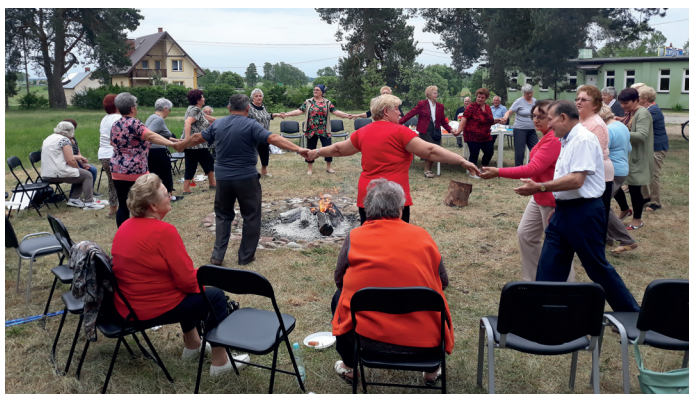
Wspólne ognisko uczestników projektu

A kademia Seniora to nowy projekt Gminnego Ośrodka Pomocy Społecznej w Goworowie, który dedykowany jest seniorom z terenu gminy Goworowo. Celem przedsięwzięcia jest wspieranie osób starszych i zapewnienie im możliwości aktywnego starzenia się w zdrowiu oraz możliwości prowadzenia w dalszym ciągu samodzielnego, niezależnego i satysfakcjonującego życia.