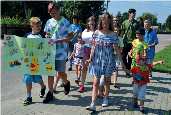
Uczestnicy projektu