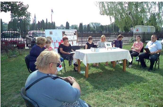
Narodowe Czytanie w GBP w Goworowie

M iesiące letnie to w bibliotece czas wyjątkowej pracy, gdyż przyjemna pogoda sprzyja możliwości organizowania wielu imprez.