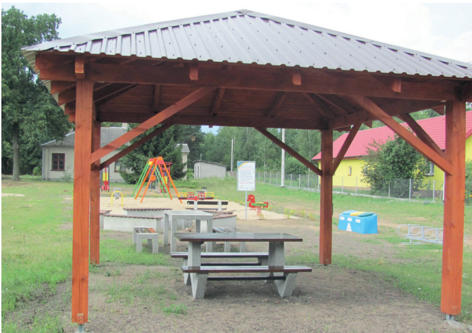
Miejsce rekreacji w Kaczcze