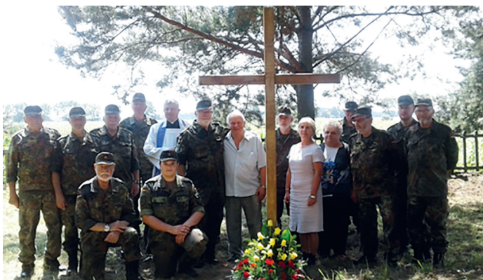
Wizyta delegacji z Meppen

C złonkowie Koła Rezerwistów Miasta Meppen w dniach od 16 do 19 lipca 2018 r. przeprowadzili prace remontowe na cmentarzu żołnierzy poległych w pierwszej wojnie światowej zlokalizowanym w miejscowości Ponikiew Duża.