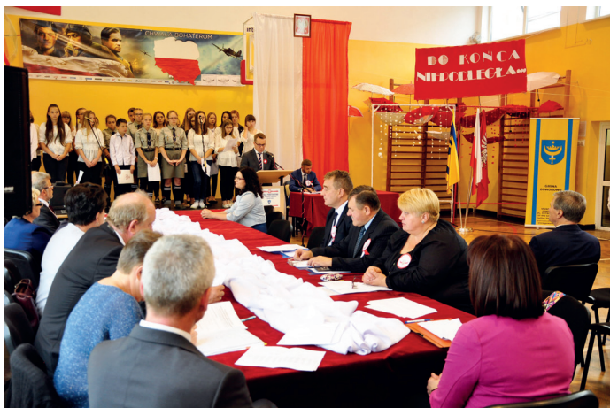
Uroczysta Sesja Rady Gminy Goworowo

D nia 28 września 2018 r. w Szkole Podstawowej im. Mikołaja Kopernika w Goworowie odbyła się uroczysta sesja Rady Gminy połączona z obchodami 100 Roczniczy Odzyskania Niepodległości przez Polskę.