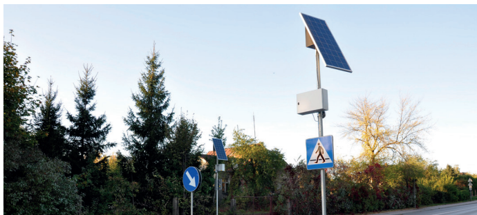
Inteligentna sygnalizacja świetlna zasilana systemem solarnym

Szkoła Podstawowa im. Mikołaja Kopernika w Goworowie we współpracy ze Starostwem Powiatowym w Ostrołęce oraz Zarządem Dróg Powiatowych w Ostrołęce zadbała o zwiększenie poziomu bezpieczeństwa dzieci i uczniów na przejściu dla pieszych, zlokalizowanego przed budynkiem szkoły podstawowej. Przejście dla pieszych przeszło gruntowną renowację i modernizację. W ramach ustaleń odnowiono znaki poziome – białe pasy na czerwonym, jaskrawym tle. Ponadto zamontowano nowoczesne oznakowanie pionowe – inteligentną sygnalizację świetlną zasilaną systemem solarnym z aktywnymi znakami D6.