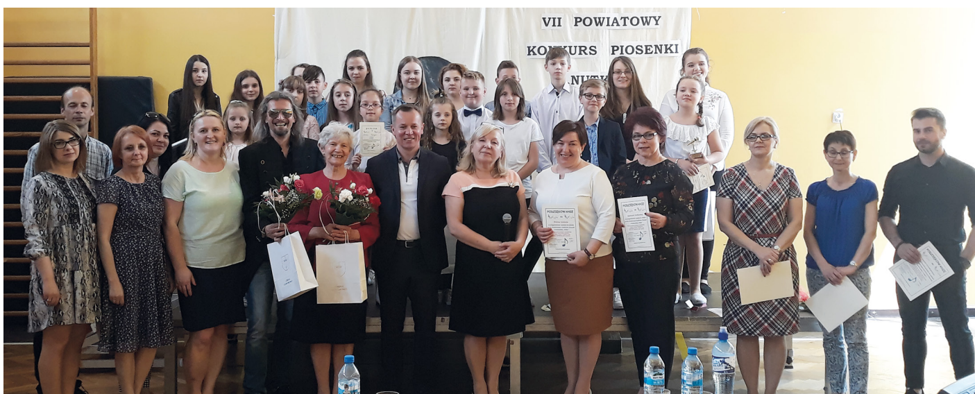
Uczestnicy, opiekunowie oraz zaproszeni goście podczas konkursu powiatowego Nutka