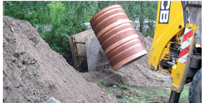
Budowa kanalizacji (fot. arch. UG Goworowo)

„Rozwój gospodarki wodno-ściekowej w dolinie rzek Orz i Narew w gminie Goworowo. Etap IV”. Najkorzystniejszą cenowo ofertę złożyły firmy MULTI-KOM Andrzej Nakielski z Ostrołki za kwotę 1 352 000,00 zł brutto w części 1 postępowania pn. „Budowa sieci kanalizacji sanitarnej w Daniłowie i Szczawinie” oraz BRUKTIM Usługi Budowlano – Projektowe Sylwester Barański z Ostrołki za kwotę 220 000,00 zł brutto w części 2 prowadzonego pn. „Budowa sieci kanalizacji sanitarnej w Brzeźnie”. Umowy mają zostać zrealizowane do 29 listopada br.;