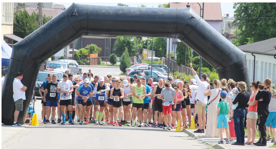
VIII BIEG GOWOROWSKI

Dwustu czterech zawodników w duchu zdrowej rywalizacji i wzajemnego wsparcia wystartowało 2 czerwca 2019 roku w VIII Biegu Goworowskim „BIEG DLA ZDROWIA”. Uczestnicy mogli spróbować swoich sił na trzech dystansach, zarezerwowanych dla różnych grup wiekowych. Miłośnicy Nordic Walking również mogli zaprezentować swoje umiejętności podczas tegorocznej imprezy. Zawodnikom na trasie biegu głównego towarzyszyli jeźdźcy na koniach ze Stajni Koni Sportowych „Viritim” z Szarlatu.