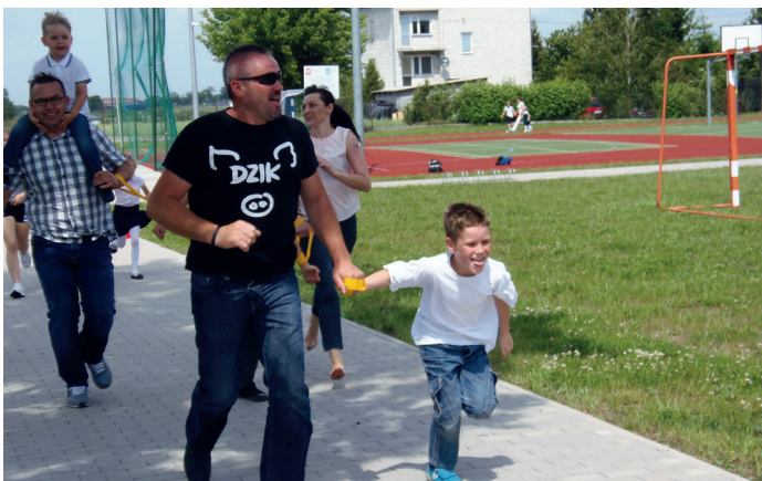
Uczestnicy festynu

27 maja 2019 r. do Szkoły Podstawowej w Pasiekach zawiązały całe rodziny. Powodem zdarzenia był festyn rodzinny, którego organizatorami była Rada Rodziców, uczniowie oraz Rada Pedagogiczna. Okazją do spotkania się całej społeczności szkolnej, ale również społeczności lokalnej, był Dzień Matki i Dzień Taty. Organizatorzy postanowili połączyć te dwa ważne dni w jeden i spędzić go wspólnie z całymi rodzinami. Pogoda tego dnia była idealna,