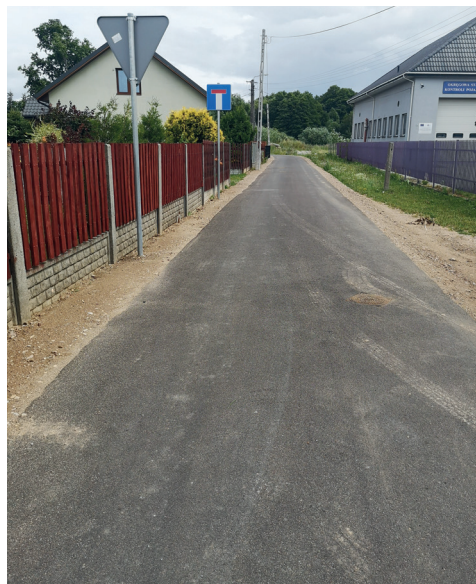
Droga w m. Wólka Brzezińska

- w ramach ogłoszonego zapytania ofertowego na przygotowanie projektów budowlanych branży drogowej najkorzystniejszą ofertę złożyła i umowę podpisała z firmą Usługi Projektowe „Drogownictwo” Marek Piasciński z Czerni za kwoty: 3 690,00 zł za projekt budowy chodnika z kostki brukowej na osiedlu w Brzeźnie, 18 450,00 zł za projekt rozbudowy drogi w Czarnowie,