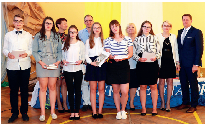
Uczestnicy uroczystości poświęconej św. Janowi Pawłowi II

Czym, a właściwie kim jest autorytet? Niełatwo jest odpowiedzieć, ale zapewne większość z nas stwierdzi, że to pewien wzór, osoba, którą chcemy i potrzebujemy naśladować. Dla małego dziecka największym autorytetem jest rodzic - wzór postępowania i kopalnia wiedzy. Kolejny etap to szkoła, a więc i rówieśnicy, którzy wywierają na nas duży wpływ. Pojawiają się pasje, zainteresowania. Oglądamy jakieś filmy, mecze, czytamy książki. Obserwujemy życie, sposób ubierania się, samochody, piłkarzy, celebrytów. W tym momencie należy właściwie odróżnić idola od autorytetu.