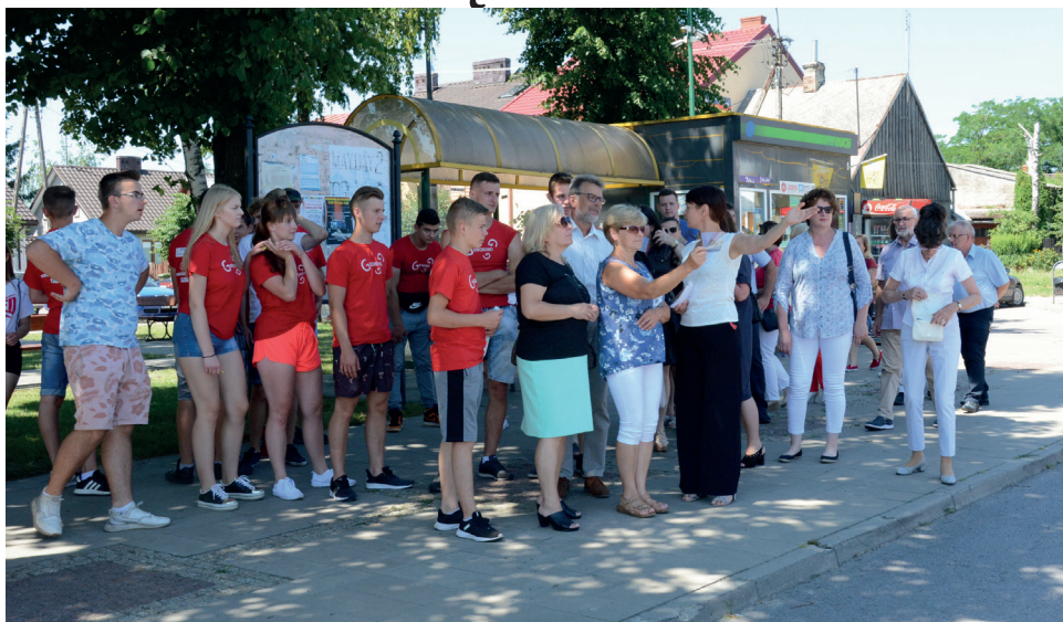
Podczas spaceru z retro fotografią można zobaczyć Goworowo sprzed lat.