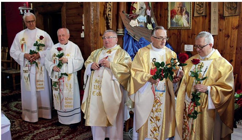
Obchody 43. rocznicy kapłaństwa proboszcza parafii w Kuninie

KAPŁAN - to on w imieniu Boga przyjmuje nas do wspólnoty wierzących, on uczestniczy we wszystkich sakramentach od chrztu świętego po sakrament chorych – przez bierzmowanie, pokutę, Eucharystię i sakrament małżeństwa. Przez cały czas obecny jest w naszym życiu, jest świadkiem naszych radości, sukcesów, wszelkich życiowych porażek, udziela nam rad i czasami napomina. We wszystkich momentach naszego życia Chrystus przychodzi do nas za pośrednictwem kapłana.