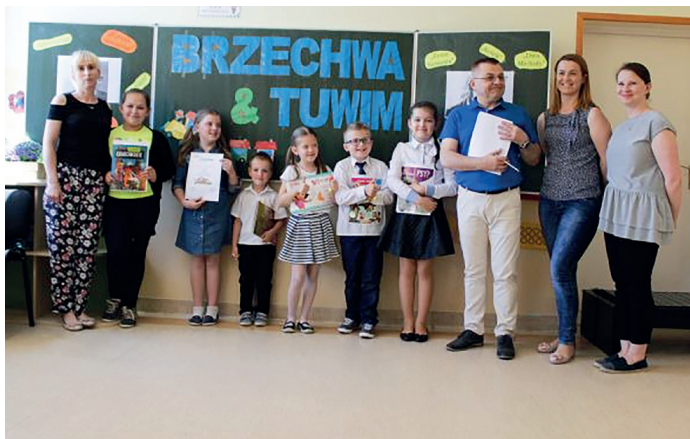
Nagrodzeni w konkursie

Wiersze dla dzieci to pewien rodzaj zabawy i nauki. Rymowanki i wyliczanki są bardzo popularne wśród najmłodszych. Cytując Wisławę Szymborską „czytanie książek to najpiękniejsza zabawa, jaką sobie ludzkość wymyśliła”.