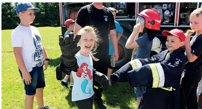
Obchody Dnia Dziecka

Tegoroczne obchody Dnia Dziecka w Szkole Podstawowej w Kuninie miały na celu promowanie zdrowego stylu życia. Impreza odbyła się 3 czerwca 2019 r. na boisku szkolnym we współpracy z rodzicami i gośćmi.