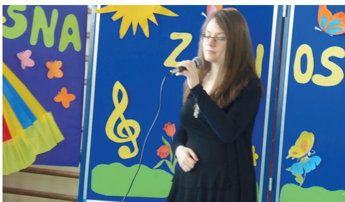
Uczestniczka podczas konkursu