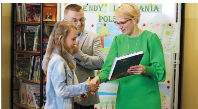
Wręczenie nagród podczas konkursu

Po co czytamy książki? Bo chcemy... bo lubimy... bo zaspakajamy ciekawość świata. Czytanie książek jest świetną odskocznią od codziennych spraw i każdy wie, że książka wycisza, uspokaja, a ta czytana wieczorem daje szansę na dobry sen. Warto więc zadbać o to, by książka stała się naszym przyjacielem. Wiele na tym możemy zyskać!