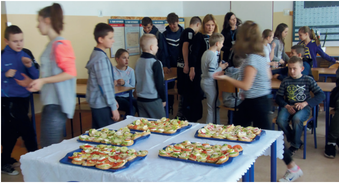
Uczniowie podczas akcji profilaktycznej

Drugie śniadanie jest często niedocenianym lub pomijanym elementem codziennej diety, chociaż jego spożywanie przynosi same korzyści. Dzięki dodaniu tego posiłku do naszej diety unikniemy kilkugodzinnych przerw w jedzeniu, co pozytywnie wpłynie nie tylko na zdrowie, ale także na wyniki naszej nauki.