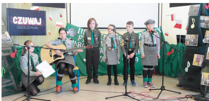
Uczestnicy festiwalu

6 kwietnia 2019 r. odbył się III Międzypowiatowy Festiwal Piosenki Zuchowej i Harcerskiej.