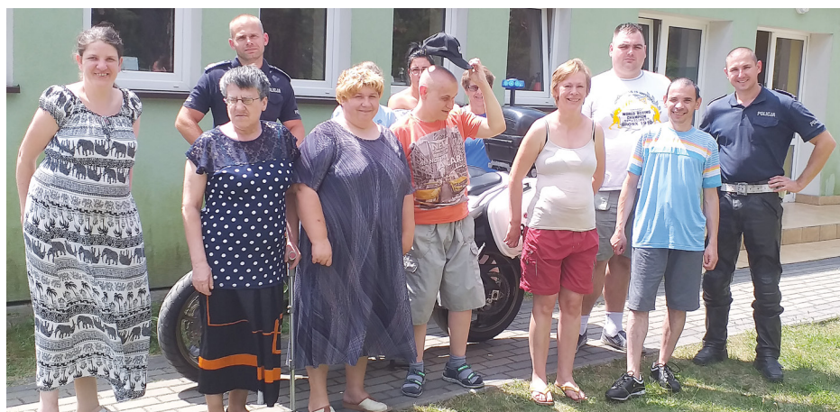
Uczestnicy spotkania z Policją (fot. arch. ŚDS w Czarnowie)

Na takie wydarzenie nasi uczestnicy z Komendy Miejskiej Policji w Ostrołęce, czekali od bardzo dawna. W piątkowe popołudnie nasz dom odwiedzili policjanci którzy na co dzień przy pomocy motocykli patrolują okolice naszego powiatu.