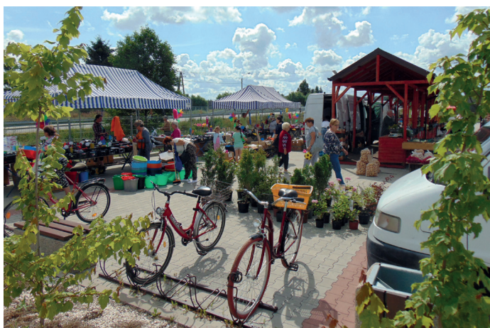
Gminne targowisko w ramach programu „Mój rynek”

Po 24 latach funkcjonowania targowiska gminnego na gruntach wsi Goworówek zostało ono przeniesione na grunty obrębu Szczawin położone przy ulicy Henryka Sienkiewicza w Goworowie.