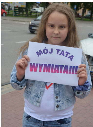
Pomysł na pozdrowienia z okazji Dnia Ojca było całe mnóstwo.

Po dużym sukcesie obchodów na świecie Dnia Matki, pojawił się pomysł, aby równie ważne święto miał tata. Dzień 23 czerwca został ogłoszony Dniem Ojca. Można świętować go w dowolny sposób. Czasami wystarczy wierszyk i laurka, by pokazać, że pamięta się o bliskiej osobie.