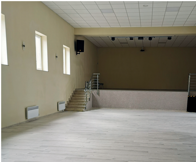
Świetlica w Goworowie po gruntownej przebudowie

- W postępowaniu przetargowym na termomodernizację świetlicy w Goworowie wpłynęło 7 ofert, z których najkorzystniejszą złożyła firma USŁUGI REMONTOWO-BUDOWLANE „Arbud” Kaszuba Arkadiusz z Pułtuska. Do dzisiaj wykonano już znaczną część prac dociepleniowych;