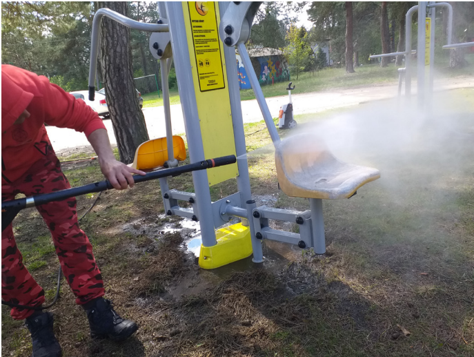
Prace porządkowe w ŚDS w Czarnowie

12 marca 2020 r. zgodnie z decyzją Wojewody Mazowieckiego Środowiskowy Dom Samopomocy w Czarnowie zawiesił swoją działalność w związku z zagrożeniem epidemią COVID-19. Zawieszeniu uległy wszelkie czynności wynikające z realizacji indywidualnych planów wspierająco - aktywizujących. W celu podtrzymania osiągniętych efektów terapii oraz wsparcia uczestników zajęć w czasie przymusowej izolacji kadra ŚDS kontaktowała się z uczestnikami za pośrednictwem rozmów telefonicznych. Czas, w którym uniemożliwiono nam realizację działań rozwojowych na rzecz społeczności ŚDS w Czarnowie postanowiliśmy poświęcić na wykonanie prac porządkowych. Odświeżeniu uległa między innymi elewacja budynku, altana oraz siłownia znajdującą w obrębie placu użytkowanego przez placówkę. Dzięki sprzyjającym warunkom atmosferycznym udało się również zadbać o otaczający teren zielony. Reorganizacji uległ między innymi ogród, zakupiliśmy również kwiaty doniczkowe. W niepogodne dni porządkowaliśmy przestrzeń znajdującą się wewnątrz budynku.