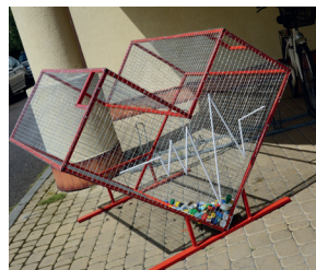
Pojemnik w kształcie serca przed budynkiem UG

Przed budynkiem Urzędu Gminy w Goworowie stanął pojemnik w kształcie serca. Mieszkańcy mogą wrzucać do niego plastikowe nakrętki bez względu na kształt czy kolor (po napojach, mleku, po chemii gospodarczej, płynach, szamponach itp.) Ważne, by nie dorzucać do nakrętek innych przedmiotów! Pojemnik na nakrętki, to nie tylko dbałość o segregację odpadów, ale także podanie pomocnej dłoni potrzebującym.