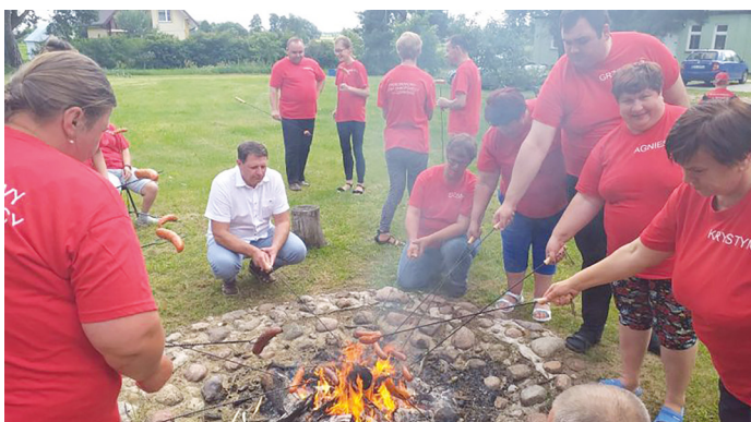
Impreza na świeżym powietrzu podopiecznych ŚDS

14 lipca 2020 roku na terenie Środowiskowego Domu Samopomocy w Czarnowie odbył się Dzień Otwarty. Bezpośrednim adresatem wspomnianego wydarzenia były osoby z rozpoznaną niepełnosprawnością, mieszkające na terenie gminy Goworowo. Spotkanie to miało na celu przybliżenie osobom nie korzystają-