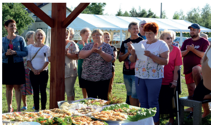
Festiwal pieroga w Żabinie