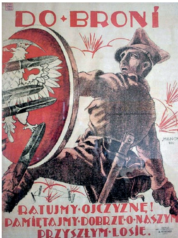
Polski plakat propagandowy z 1920 r. wzywający do walki