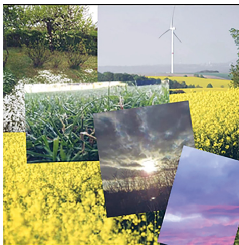
Zdjęcia konkursowe

w konkursie fotograficznym zorganizowanym przez pedagoga szkolnego. Celem tego przedsięwzięcia było uwrażliwienie dzieci i młodzieży na piękno otaczającego świata, rozwijanie umiejętności obserwacji i pokazanie, że mimo nowej rzeczywistości, w której się obecnie znajdujemy, nadal możemy cieszyć się niezwykłymi zjawiskami przyrody. W konkursie wzięli udział uczniowie z klasy VI i VIII.