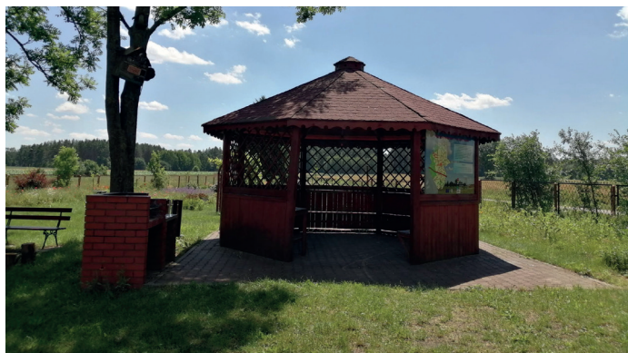
Odświeżona altana w Lipiance

Gminny Ośrodek Kultury, Sportu i Rekreacji w Goworowie odświeżył dla Was szlak rowerowy na trasie Goworowo – Daniłowo – Kruszewo – Cisk – Lipianka. Trasa rozpoczyna się na