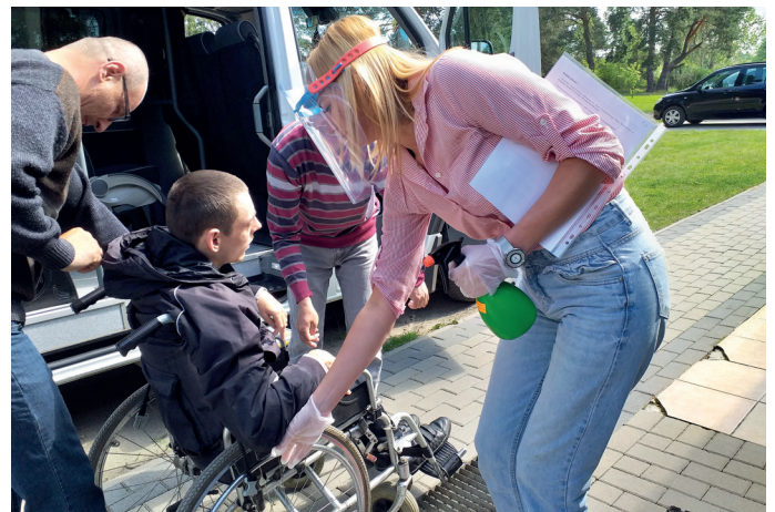
Powrót podopiecznych ŚDS w Czarnowie