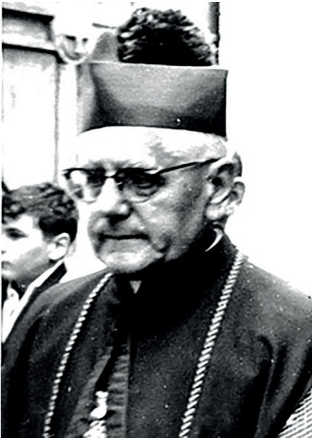
Biskup Piotr Dudzic

Zmarł nagle w Nasielsku 13 czerwca 1970 r., tuż po udzieleniu sakramentu bierzmowania, po przejściu na plebanię, wskutek silnego i gwałtownego ataku serca. Następnego dnia miał udzielić święceń dwóm diakonom.